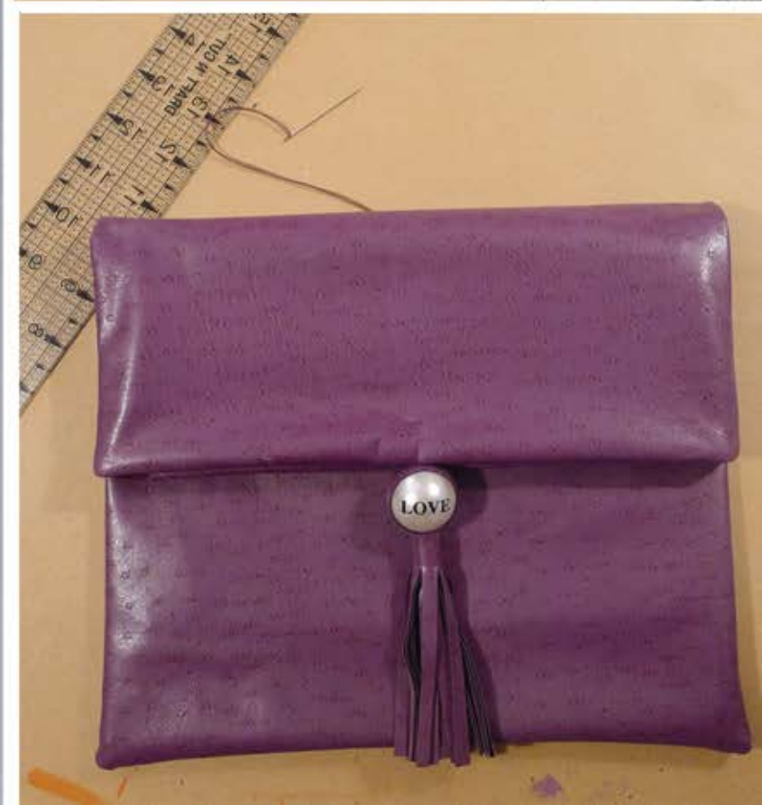
τσάντες: δερμάτινες, φάκελο και clutch στυλ